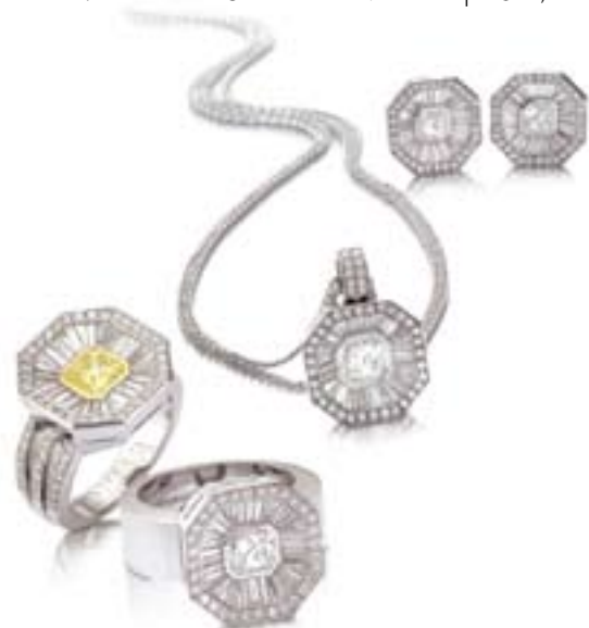
צילומי תכשיטים מתערוכת Basel World

- כיצד אתם מתמודדים עם נושא אבטחת הסחורה היקרה? "אבטחה היא אכן אתגר גדול בכל הקשור להיערכות לקראת תערוכה בחו"ל, ואנו כבר מיומנים בכך. אנחנו שולחים את התכשיטים בדיוור מאובטח ולא לוקחים שום סיכון. במהלך התערוכה, מספקים מארגני היריד אבטחה מצויינת."