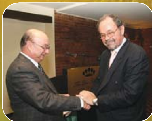
לשכת המסחר ישראל-שוויץ וליכטנשטיין נפרדת מפרנסואה שפואי, שגריר שוויץ בישראל, ידיד אמת של הלשכה ושל מדינת ישראל