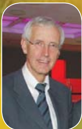
סיקור ביקורו בישראל של ז'אן-דניאל גרבר, שר הכלכלה השוויצרי