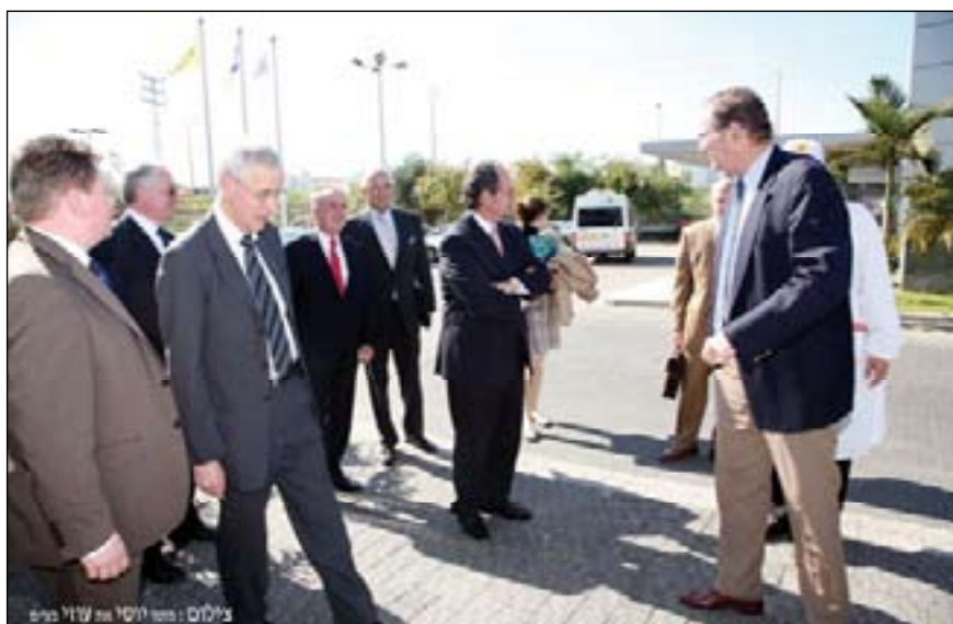
Visiting Osem-Nestle factory at Sderot

Gerber: "In this region, you are like an island much in the same way that Switzerland is an island as we do not belong to the European Community. Neither country has natural resources and must therefore utilize and reinforce their most predominant advantage - their human capital. This has always been essential for both countries and, in the future, the importance of human capital will become more and more crucial"